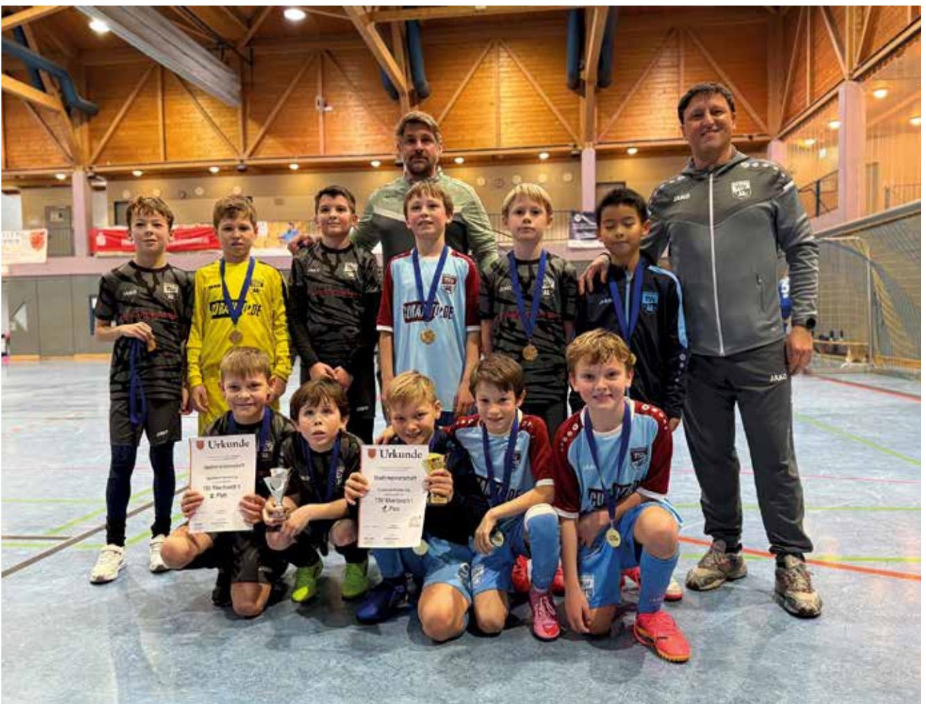
Die U11 des TSV siegte souverän bei der Stadtmeisterschaft 2026.

Mit drei Stadtmeisterschaften im Juniorenbereich bestätigte der TSV Meerbusch seine hervorragende Jugendarbeit. Der TSV Meerbusch freut sich als Ausrichter besonders über den großen Zuschauerzuspruch und den reibungslosen Ablauf der diesjährigen Stadtmeisterschaften.