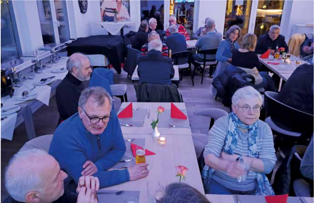
Kurz vor der Eröffnung des Buffets bei der JAF.