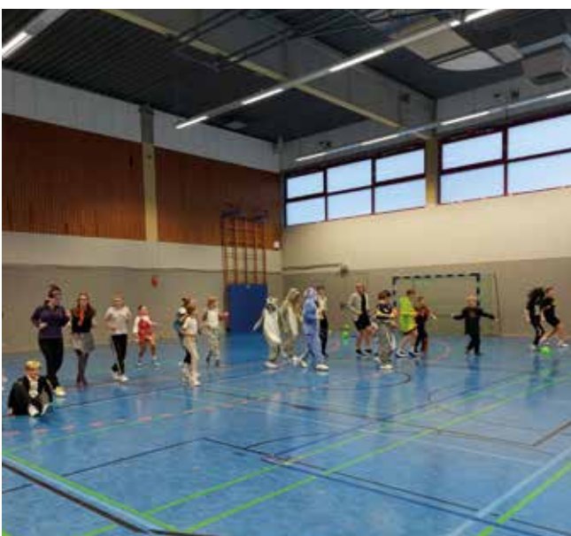
Gemeinsames Aufwärmen darf natürlich auch nicht fehlen.