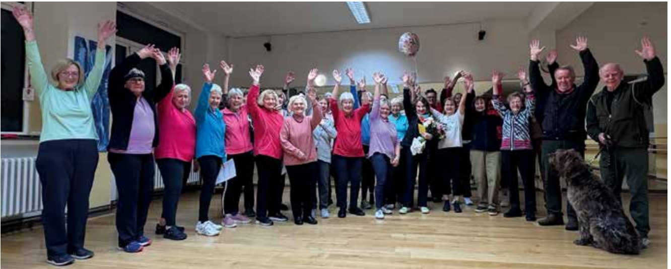
An Sport war an diesem besonderen Mittwoch nicht mehr zu denken. Es wurde gefeiert!