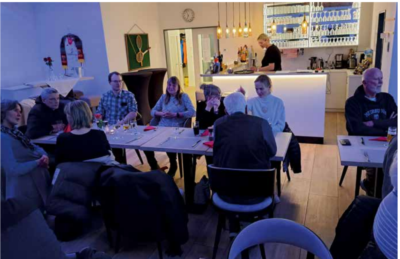
Gesellige Runde bei der JAF.