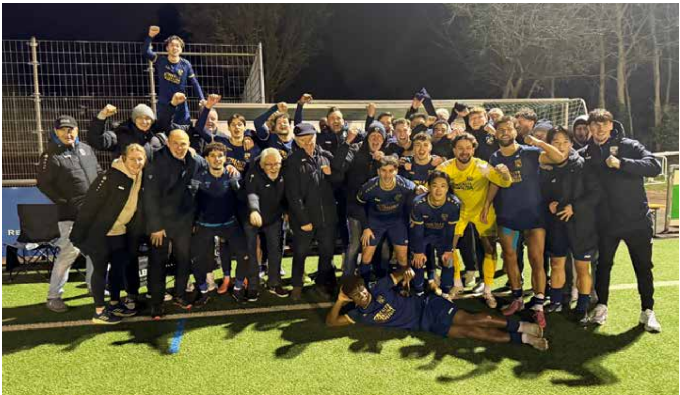
Auch bei der SG Holzheim holte das Team mit einem 1:0 Auswärtssieg drei Punkte.

Diese beeindruckende Siegesserie etabliert die 1. Mannschaft des TSV Meerbusch fest in den oberen Tabellenregionen. Die letzte Platzierung vor Redaktionsschluss dieser Ausgabe von MeinVerein war sogar ein hervorragender dritter Tabellenplatz. Damit können die Verantwortlichen und Fans optimistisch auf die nächsten Spiele der Oberliga-Niederrhein schauen.