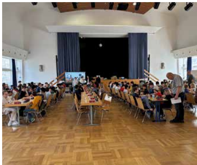
Die Aula des Humboldt-Gymnasiums war am 8.3. fest in der Hand der Schachjugend.

Text: Thomas Cieslik