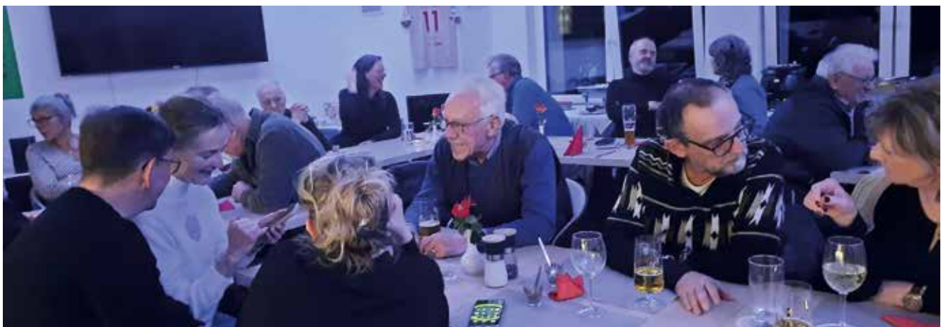
Gute Gespräche bei der JAF.