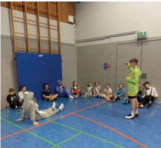
Neben normalem Badminton wurden auch andere Spiele gespielt.