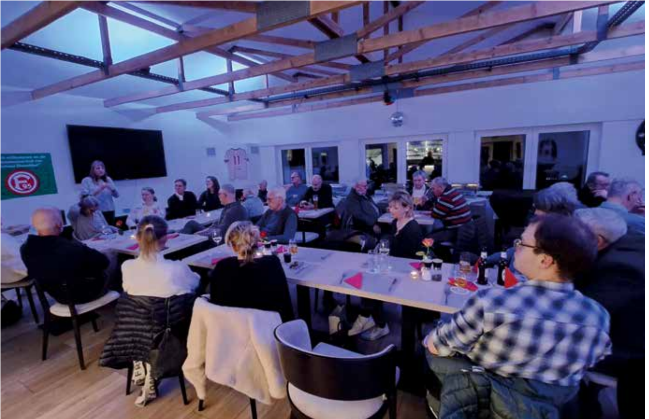
Vorstellung des neuen Trainingkonzepts bei der JAF.