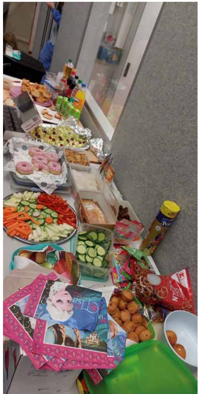
Jeder steuerte etwas zu einem tollen Buffet bei.