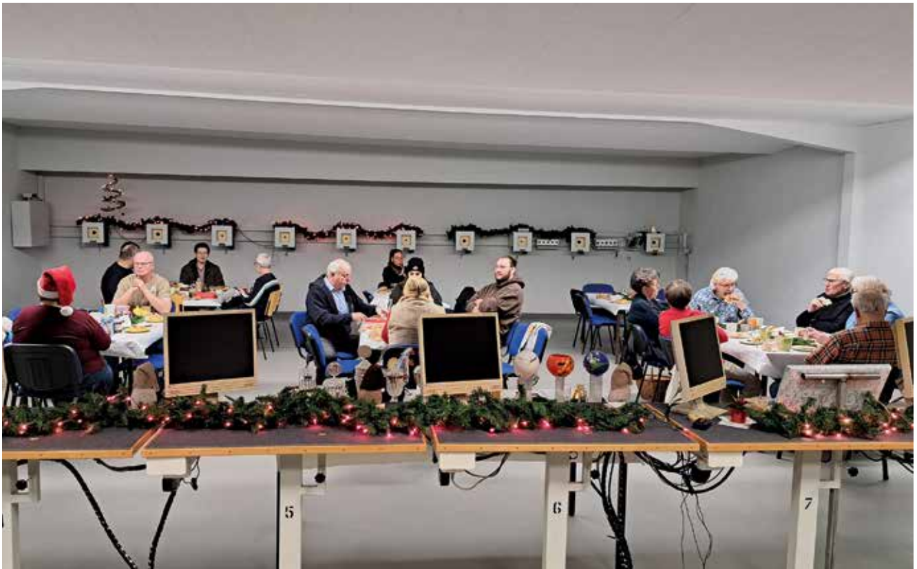
Text: Martin Blickmann