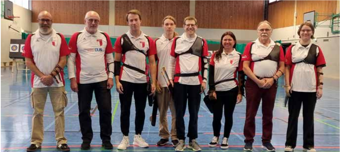
Bogensport-Mannschaft des SSV-Strümp.

Die Fachschaft Schießen, eine Abteilung des Stadtsportverbands Meerbusch, richtete auch in diesem Jahr die Stadtmeisterschaft im sportlichen Schießen aus. Die ausgetragenen Disziplinen umfassen: Luftpistole freistehend und aufgelegt, Luftgewehr freistehend und aufgelegt, Bogen (Recurve und Blank), Sportpistole, Großkaliber Revolver und Pistole, Freie Pistole sowie Blasrohr, Lichtgewehr und Lichtpistole. Zahlreiche Schützinnen und Schützen aus den Meerbuscher Schießsport- und Schützenvereinen traten in den genannten Disziplinen an, um die diesjährigen Stadtmeistertitel zu erringen. Erfreulicherweise starteten auch einige vereinslose Meerbuscher Bürger bzw. Bürgerinnen als Einzelschützen. Die Jugend war sehr gut vertreten. Die Bogensport-Disziplinen wurden in der Sporthalle des Meerbusch-Gymnasiums durchgeführt.