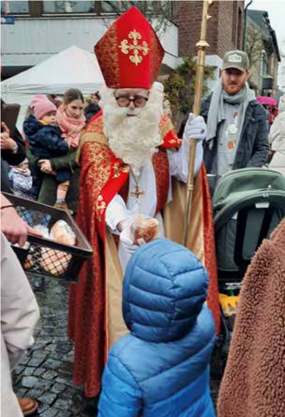
Impression vom Nikolausmarkt in Lank.