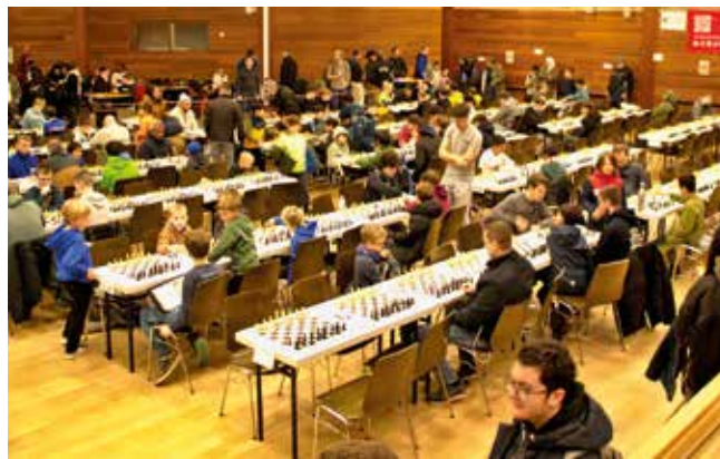
Blick in den Turniersaal in der Rurtalhalle, Düren-Lendersdorf.