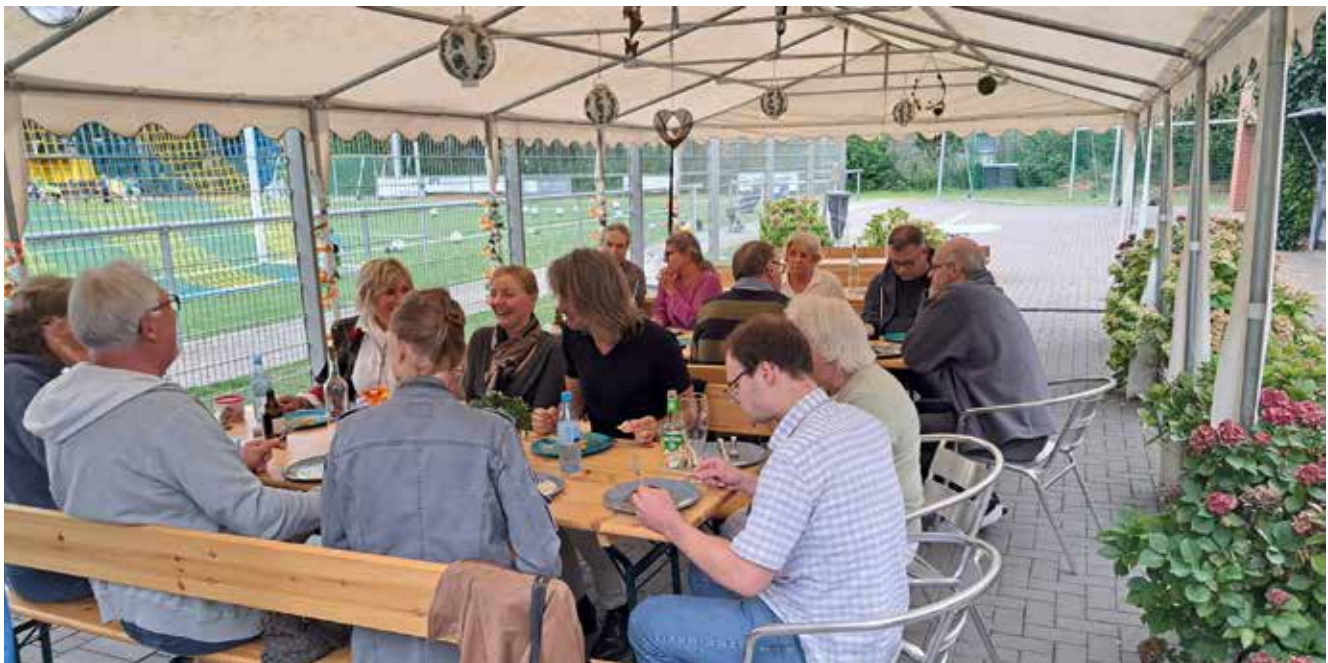
Fröhliche Runde beim Sommerfest des Running Teams am 22.08.2025.

So gerne wäre ich dabei gewesen, doch leider musste ich krankheitsbedingt zu Hause bleiben und konnte nur in Gedanken mitfeiern. Doch beim nächsten Mal bin ich mit Sicherheit wieder dabei.