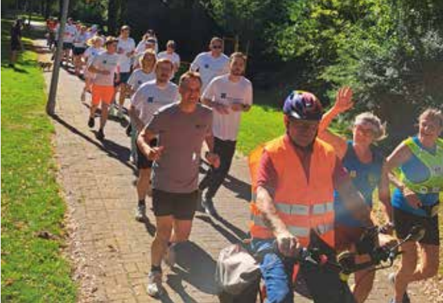
Unterwegs beim Hospizlauf am 07.09.2025.

Zu diesen schönen Ergebnissen gratulieren wir euch herzlich!