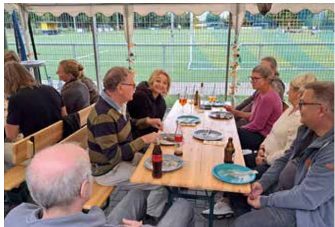
Gute Stimmung beim Sommerfest des Running Teams am 22.08.2025.