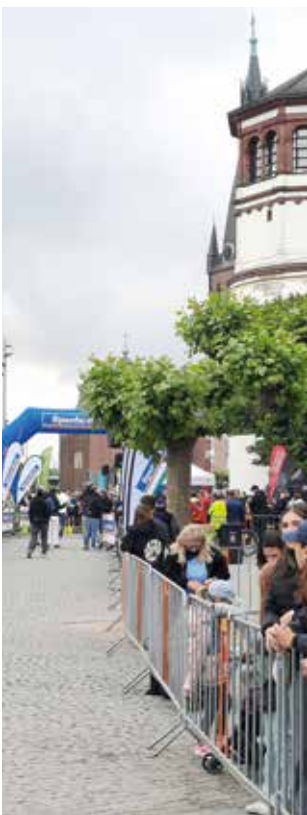
Gespanntes Warten auf den Startschuss zum Brückenlauf.

Der Brückenlauf ist eine sehr schöne Veranstaltung, die immer wieder großen Spaß gemacht hat und die ich wirklich sehr empfehlen kann. Auch wenn ich diese Mal selbst nicht mitlaufen konnte, war es dennoch sehr schön, dabei zu sein und alle anzufeuern. Aber im nächsten Jahr möchte ich doch lieber wieder selbst laufen.