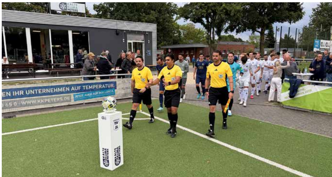
Text: Klaus Radek

Aufgabe des Trainerteams ist es nun, dass die Mannschaft dieses Potential konstant auf den Platz bringt. Nur Erfolgserlebnisse geben der Mannschaft das dafür nötige Selbstvertrauen und Selbstbewusstsein. Das Trainerteam um Marcel Winkens verfügt aber über die Erfahrung, an den richtigen Stellschrauben zu drehen, um die nächsten Spiele erfolgreich zu bestreiten.