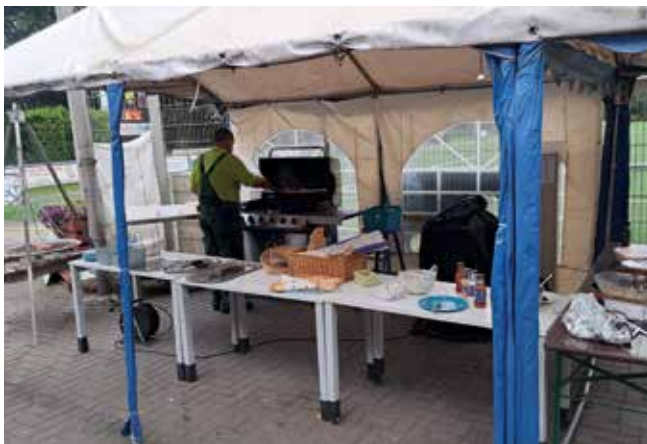
Für das leibliche Wohl war bestens gesorgt beim Sommerfest des Running Teams.