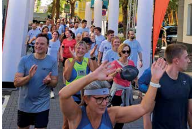
Zieleinlauf beim Hospizlauf.

Ein großer Dank geht an Petrus, der uns für beide Laufevents das richtige Wetter geschickt hat, und den Veranstaltern und den Teilnehmenden noch einmal einen letzten schönen Sonntag beschert hat.