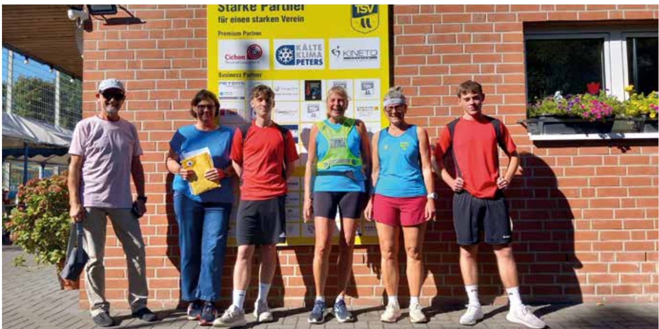
Startpunkt TSV Meerbusch in Bösinghoven beim Hospizlauf.

Alle Startgelder und die Spenden, die durch diese Veranstaltung eingenommen und zu 100% an das Hospiz weitergegeben werden, ermöglichen viele Aktionen für die Heimgäste, die nicht von den Krankenkassen übernommen werden. So können die Teilnehmer*innen des Laufs mit ihrem Beitrag Solidarität mit den schwerstkranken Menschen zeigen, Berührungängste überwinden und die wichtige Hospizarbeit unterstützen.